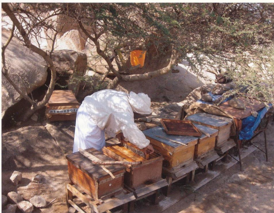
Abb. 02 - Die einheimische Bienensorte in Saudi Arabien ist A.m. yemenetica , die an die extremen Bedingungen dieses Landes gut angepasst ist. Auch hier, wie in vielen anderen Ländern des Nahen und Mittleren Ostens besteht eine rege Nachfrage nach der Carnica Rasse. Carnica Völker zeigen unter den klimatischen Bedingungen dieser Länder keine überzeugende Leistung und hohe Verluste. Trotzdem zerstören die zunehmenden Importe Europäischer Bienenvölker die einheimische Rasse.

Vielfalt (Abb. 2). Die bedrohten Rassen - bei Erhalt ihrer Anpassung an die lokale Umwelt - züchterisch an die Bedürfnisse der Imker anzupassen, fördert nachhaltig den Erhalt der genetischen Vielfalt. Wesentliche Ressourcen innerhalb des neuen, im November 2014 begonnenen, EU Projekts „Smartbees“ ( http://smartbees-fp7.eu/ ) werden für das oben skizzierte Vorgehen verwendet, um das Verschwinden der anderen bedrohten Europäischen Bienensorten aufzuhalten. Für die Mellifera Rasse bestehen schon vorbildliche Initiativen in Österreich, Norwegen und der Schweiz.